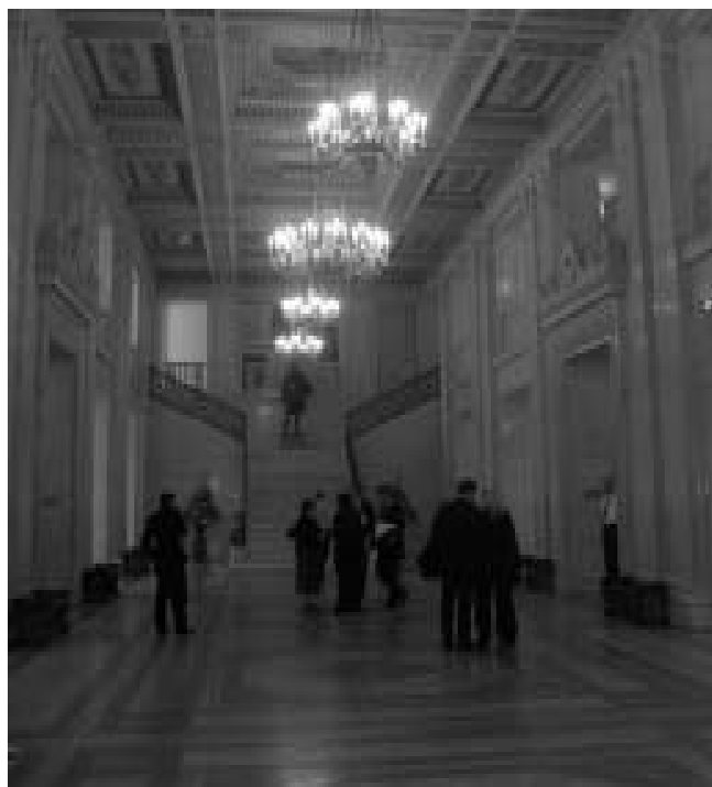
Het parlement in Belfast

Dit keer werd de reis niet met een gaaf feest afgesloten, maar iedereen kroop doodmoe om 23:00 uur in zijn bed. We werden namelijk om 6 uur alweer gewekt, want 7 uur stond de bus klaar die ons naar het vliegveld zou brengen. Dat dachten wij in ieder geval... Na een drie kwartier in de bus te hebben gezeten, bleek dat de buschauffeur ons naar New Castle aan het brengen was. Toen hij hoorde dat wij een vlucht moesten halen, keerde hij om en reed als een gek naar het vliegveld. Hier kwamen wij 5 minuten te laat voor het inchecken. Het eerste antwoord dat we kregen, was dat morgen weer een vlucht ging. Maar gelukkig wilde EasyJet ons toch nog meenemen naar Amsterdam. Al met al kwamen wij precies als gepland om kwart over twaalf op Schiphol