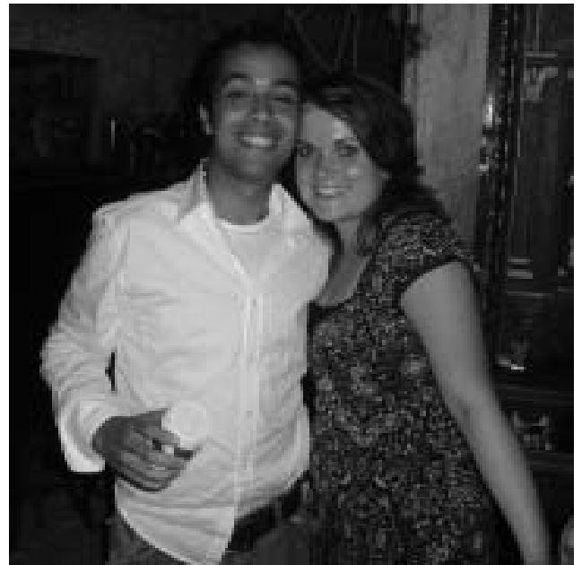
Woensdag 13 september was het B.I.L.-diner. Op deze pagina een selectie van de foto's.