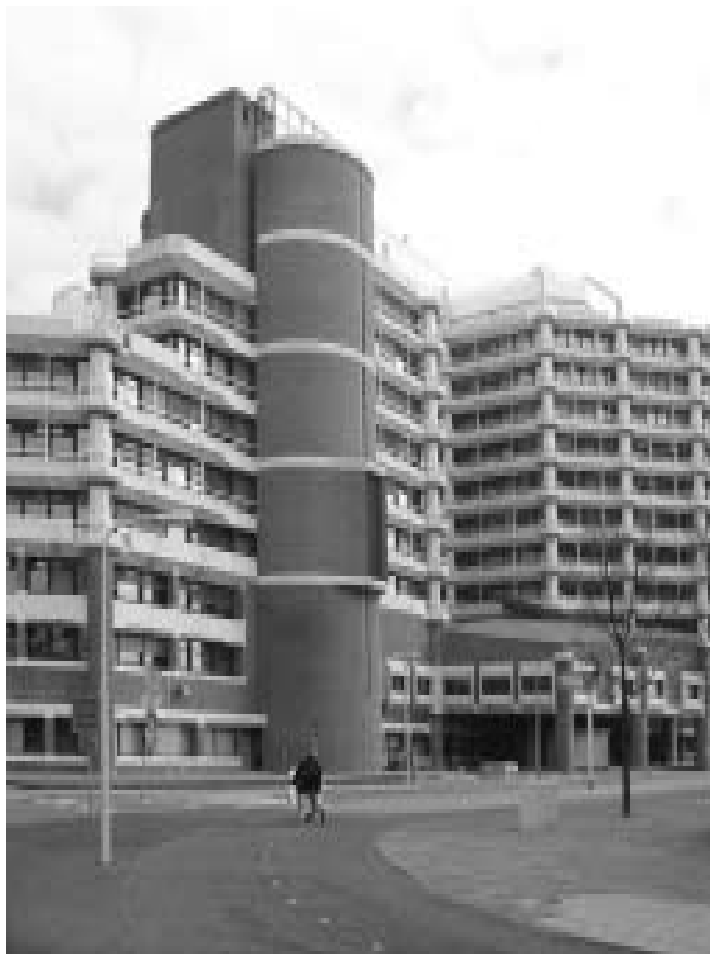
Trots op 'de Apenrots': Bezuidenhoutseweg 67, waar het ministerie van Buitenlandse Zaken zetelt