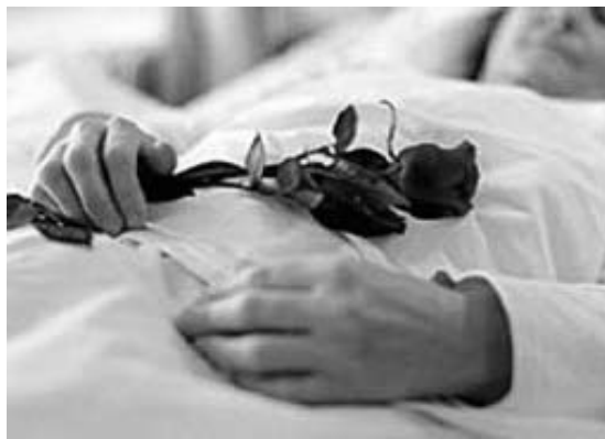
Sterven of versterven?

De nieuwe richtlijn palliatieve sedatie van de KNMG is in december 2005 gepubliceerd. Het doel van palliatieve sedatie is het bestrijden van refractaire symptomen zonder het leven te verkorten of te beëindigen. 5 Onder refractaire symptomen vallen één of meer ziekteverschijnselen die niet meer op een adequate manier zijn te behandelen volgens de conventionele geneeswijzen. Deze refractaire symptomen zijn lichamelijk of psychisch van aard en zijn de oorzaak van het ondraaglijke lijden van de patiënt. 6 Indien deze ziekteverschijnselen nog wel te behandelen zijn en de bijwerkingen als onaanvaardbaar worden gezien kan ook tot palliatieve sedatie worden besloten.