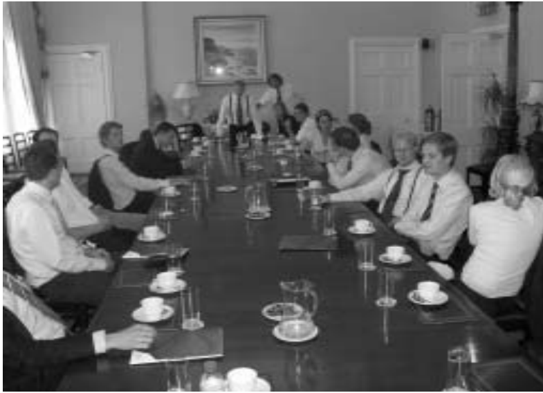
Op bezoek bij de Garda: de politie in Ierland.

Na een bezoek aan het ministerie gingen we naar een klein