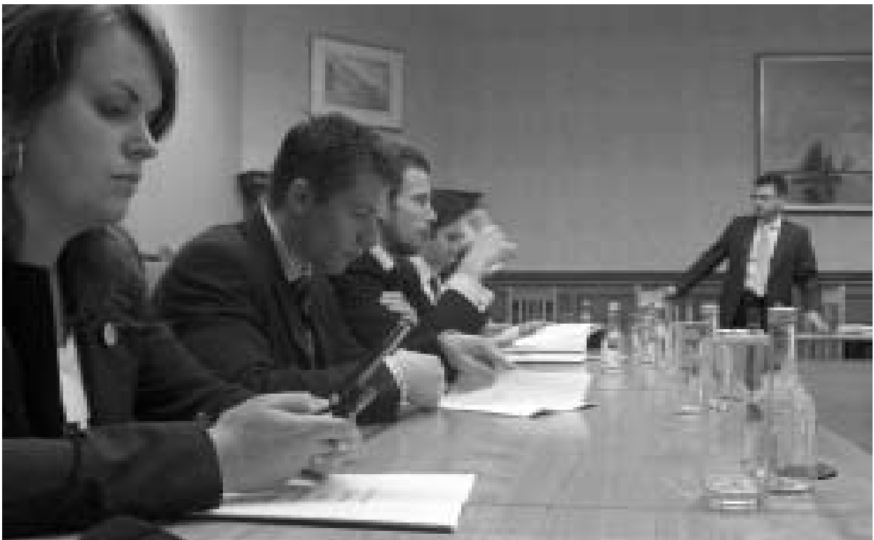
Excursie naar The Departement of Foreign Affairs