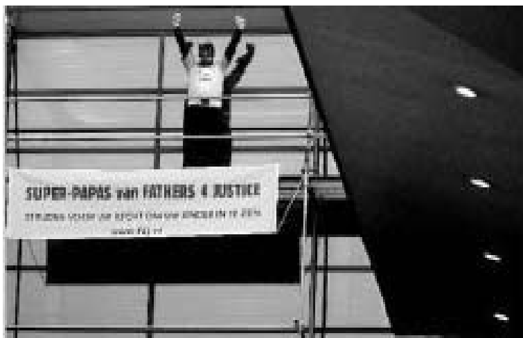
Belangengroepen bedenken steeds weer nieuwe manieren om in de media te komen.

De studies over de veranderende relatie tussen kiezers, media