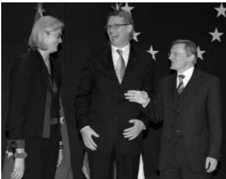
Premier van Finland, Matti Vanhanen, heeft het tegengaan van verkokering tot een van de speerpunten gemaakt van het Finse voorzitterschap van de EU.

Het probleem van verkokering is in de Raad van Ministers van een geheel andere aard dan bij een nationale overheid of bij bijvoorbeeld de Europese Commissie.