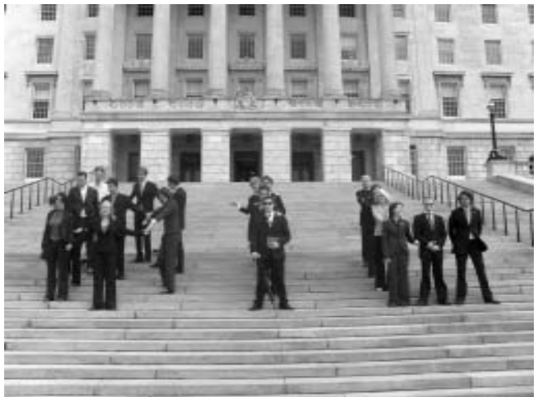
Een poging om de letters B.I.L. te vormen: de 'B' is niet helemaal gelukt.