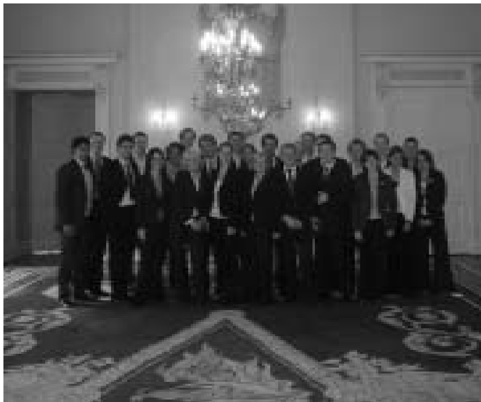
Groepsfoto in The President's Office

Een bezoek aan het parlement maakte de donderdag compleet. Hier werden we door Pat Rabbitte ontvangen, de leider van de Labour Party. Deze partij is al sinds het ontstaan van het parlement in 1922 actief. Daarnaast waren er nog twee conservatieve partijen actief. Pas de afgelopen twintig jaar zijn er nieuwe partijen bijgekomen, zoals de socialistische partij, de groene partij en de Sinn Féinn. De Ierse maatschappij werd eerst door de kerk gedomineerd waardoor handel met andere landen pas in de jaren '60 opkwam. De toetreding tot de Europese Unie was erg belangrijk voor Ierland. De economie is er